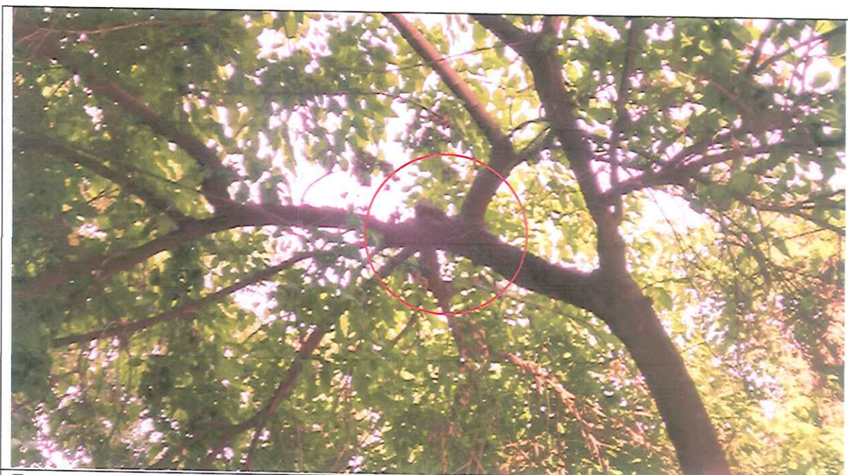
Foto 1 : Se observa en sector circulo como la rama esta desgajada y a punto de caer sobre cables eléctricos.