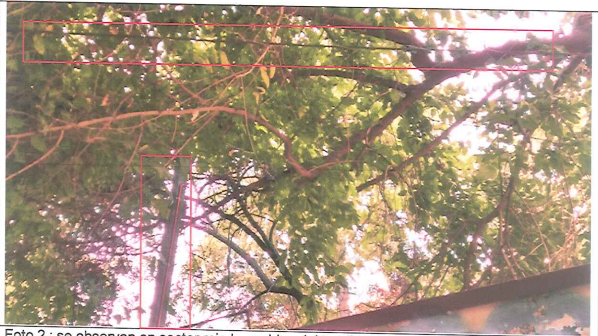
Foto 2 : se observan en sector rojo los cables del tendido electrico que abastece de energía al Edificio de Quimica.